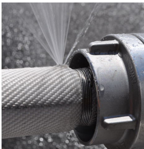
Ohne G & H HOSE-GUARD