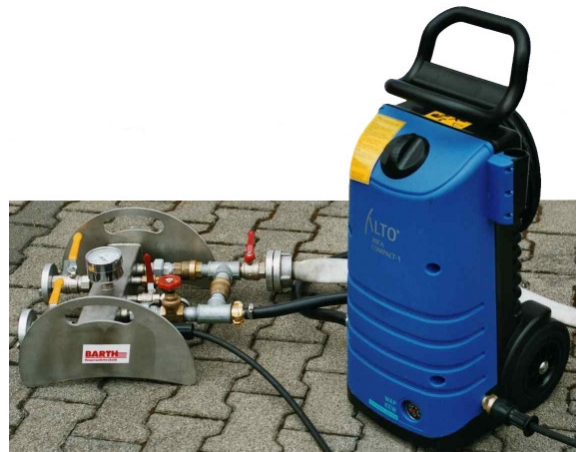
P 2001 in Kombination mit Hochdruckreiniger

Der Prüfadapter zeichnet sich durch eine langlebige und verschleißarme Konstruktion aus. Der Druckkessel sowie die Gleitfüße sind aus Edelstahl gefertigt, die komplette Verrohrung ist aus verzinktem Stahl.