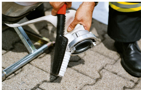
Handbürste zur Reinigung von Kupplungen

Der MINI-WICKLER für Schläuche bis Größe B kann dann an der Aufstiegsleiter des Fahrzeuges zusammen mit dem MINI-CLEANER eingehängt werden.