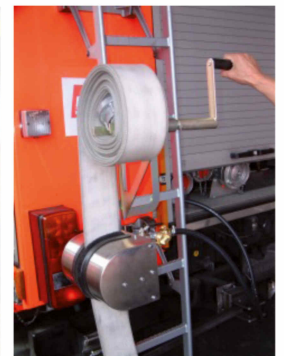
Auch an Aufstiegsleiter am Fahrzeug zu montieren